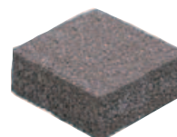
Beispiel Quadroton 20 x 20 x 8 cm