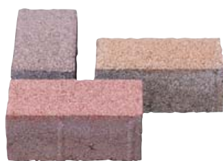
Indian Summer Öko 20 x 10 x 8 cm